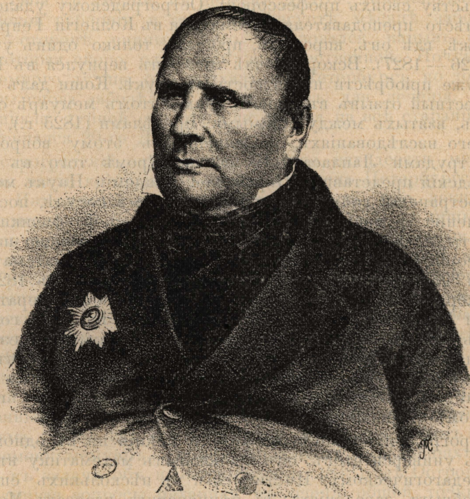
М. В. Остроградский.

Род. 12 Сентября 1801 г. † 20 Декабря 1861 г.